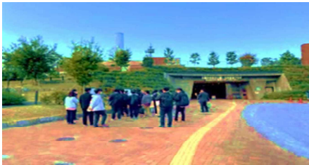
三鷹中央防災公園

また、当該研修の講義をライブ研修として、リアルタイムでも配信いたします。皆様のご参加をお待ちしております。