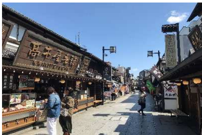
帝釈天参道(葛飾区柴又)

主催 一般財団法人 全国建設研修センター 後援 国土交通省 全国知事会・全国市長会・全国町村会