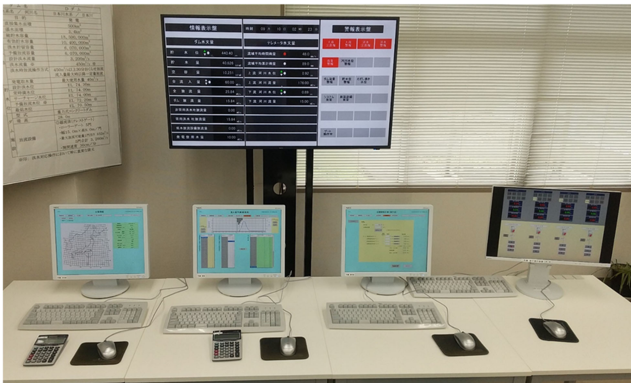
【ダムシミュレータ】