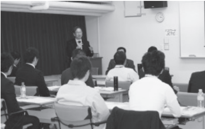
課題研究の発表（上）と講師による講評

い、その対策に向け工夫を凝らし積極的に取り組んでいる様子が伝わってきた。そして全体討議の後、三名の講師による講評が行われ、国土交通省の早川課長補佐からは次のコメントがあり、三日間の研修を終えた。